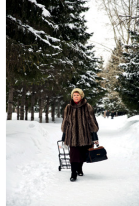
KARŞI SAYFADA: Khuzir köyü kıyısında Baykal Gölü. BU SAYFADA ÜSTTEN SAAT YÖNÜNDE: Sibirya kurtları; Kirilmalar sonucu oluşan buz detayı; Pervomaisky Skver parkında bir kadın.

Saatler sürecek yolculuğa gece geç vakitte başladığım ve bütün gün şehri turladığım için yatağımı hazırlıyor ve uyumak istiyorum. Öyle bir uykuya geçiş ki, kulağımda trenin sesi, camda soğuşun