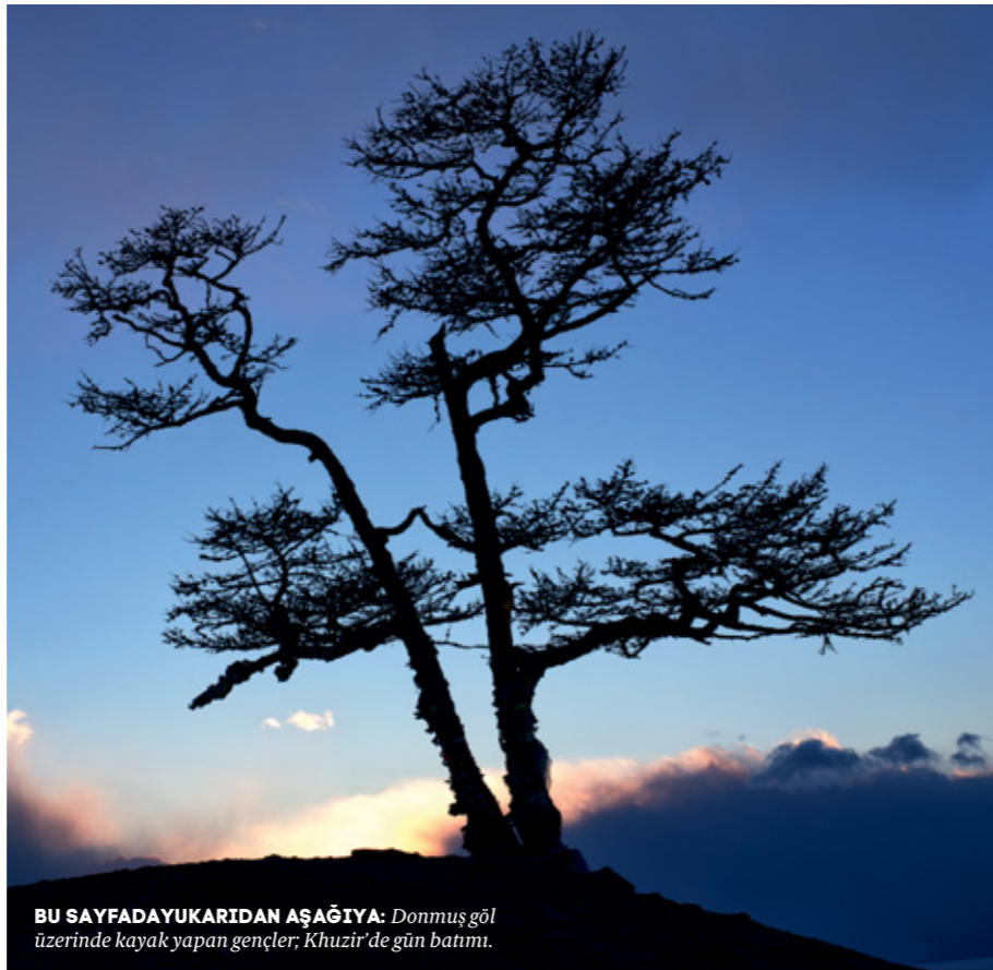
BU SAYFADAYUKARIDAN AŞAĞIYA: Donmuş göl üzerinde kayak yapan gençler; Khuzir'de gün batımı.