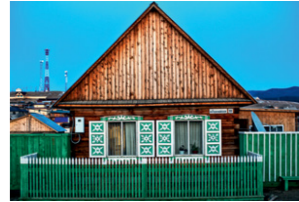
BU SAYFADA SAAT YÖNÜNDE: Trans Sibiry Ekspres'den kış manzarası; Göl üzerindeki mağaralarda oluşan sarkıtlar; Khuzir köyünde minik bir ev.